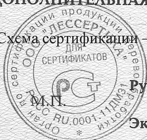
Схема сертификации – Зс по ГОСТ Р 53603-2009.